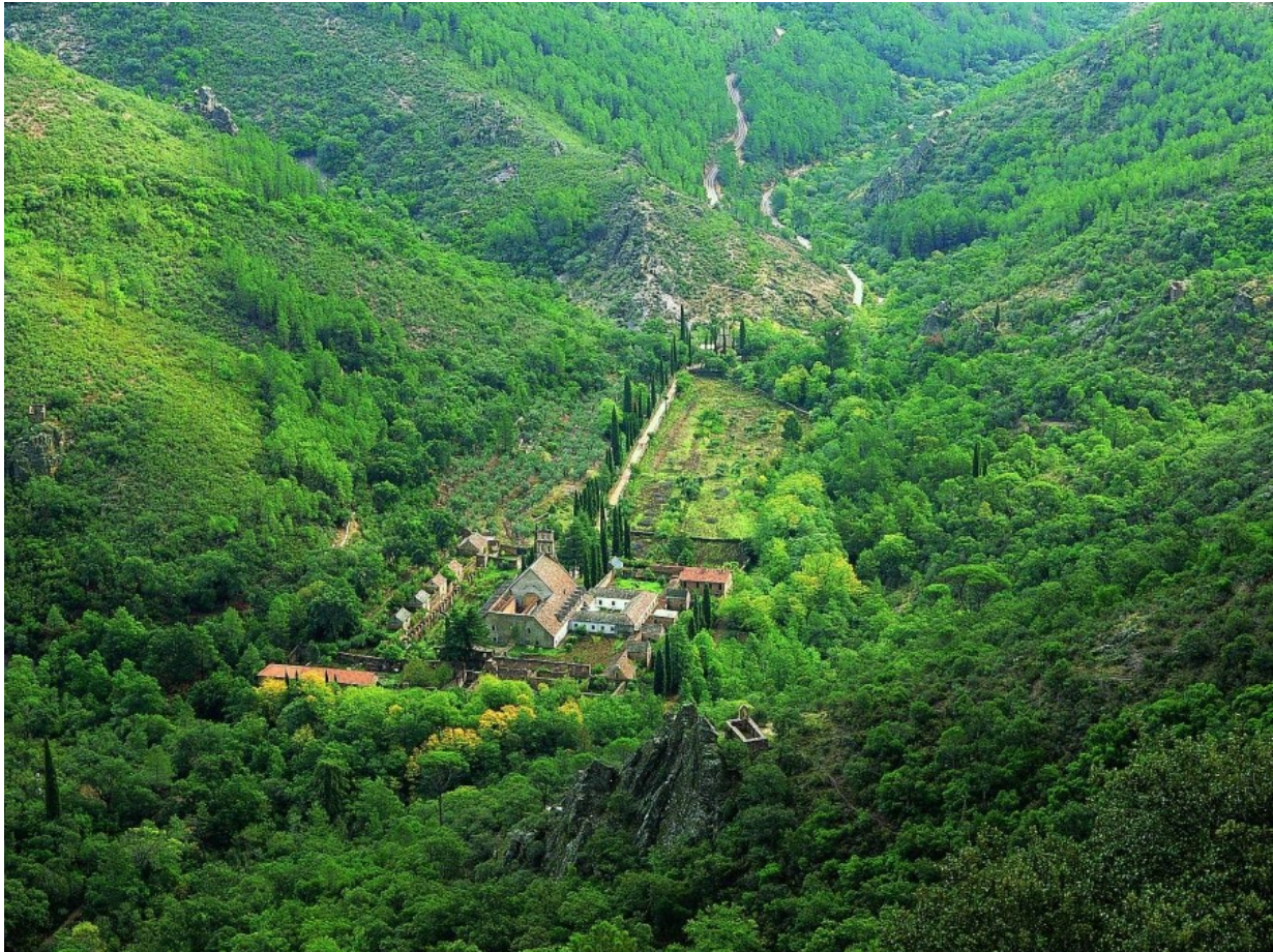
Monasterio de Las Batuecas